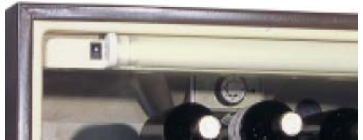
Iluminación y interruptor