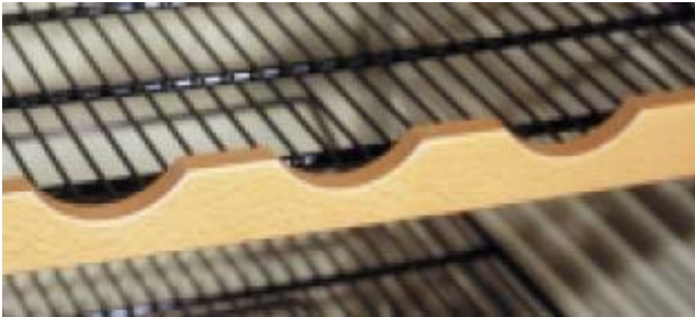
Estantes de hilo con frente de madera y forma de botella